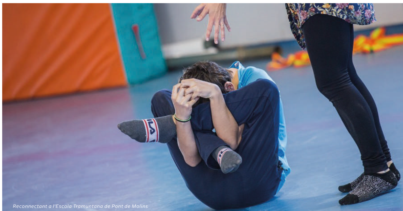
Reconnectant a l'Escola Tramuntana de Pont de Molins