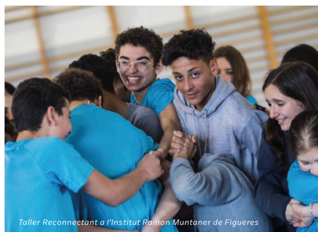
Taller Reconnectant a l'Institut Ramon Muntaner de Figueres